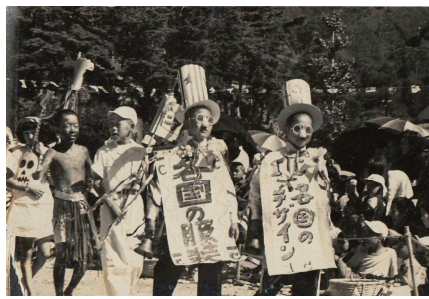
【1954年 1-C 「世界の服装」】