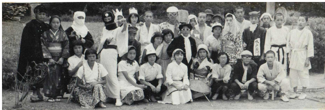
【1958年 集合写真 クラスは不明】

松柏中学校では、1972年度以前において、卒業アルバムが発行されていないことを、この通信でお伝えしてきました。にも関わらず、地域の方から数多くの写真や資料、そして証言を提供していただきました。今回は、1950年代後半(昭和20年代)から令和まで、運動会における仮装の変遷を「一気に」紹介していきます。1973年度以降においても、卒業アルバムには運動会の仮装の写真は必ず掲載されているわけではなく、大まかな流れになっています。今回の報告後、読者の皆様から、「自分たちの頃の運動会ではこうだった。」という情報を寄せていただけると助かります。