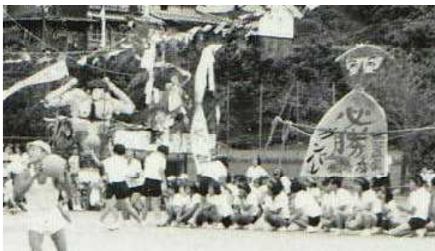
【1963年 ブロック席の様子】