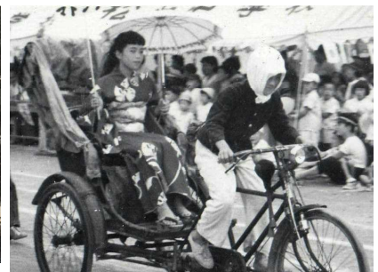
【1958年 「坊っちゃん」の マドンナらしい】