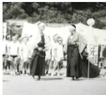
【1973年】幕末の志士「進先組」(ママ)とある。