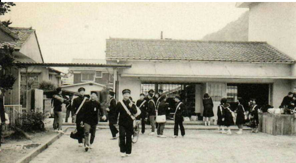
さあ、下校だ。西校舎玄関（現在の農具室）からの様子です。奥に正門。手前の生徒は運動場を横切って東側を。（1977年）

表側に紹介した4つの謎、旧校舎や西校舎の間取りについても情報を探しています。年代によって異なるとは思いますが。玄関はどこ、廊下は校舎のどっちに？職員室は旧本館の西側1階？西校舎に1年生と3年生、本館の2階に2年生で、1階が特別教室（調理室や理科室）？これ以外の情報でもかまいません。